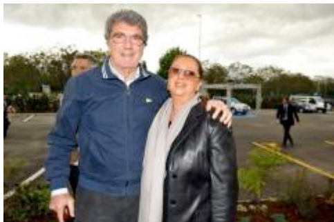
DINO ZOFF E SIGNORA

«Sentì più di ogni altro la carenza di vocalità dell'italiano. Avendo l'italiano poca voce, necessita del supporto del canto o del dialetto. Ma Gadda non era uno scrittore dialettale. Inventò una lingua vocale che si appoggiava ai dialetti. Si comportò come Dante con la Commedia. Che dopo aver detto che tutti i dialetti fanno schifo, che non ce ne è uno che valga "la pantera profumata del volgare illustre", scrive utilizzando di tutto: desinenze, calate, strutture sintattiche delle parlate che conosceva e perfino di quelle che gli erano ignote».